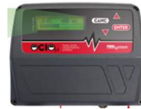
SISTEMI DI CONTROLLO ELETTRONICI E INDICATORI DI LIVELLO