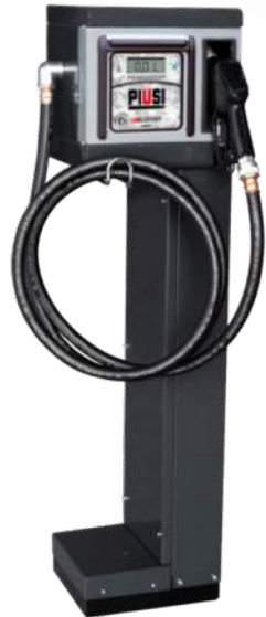
SOLUZIONI INTEGRATE PER IL MONITORAGGIO CARBURANTE E GESTIONE DELLE FLOTTE